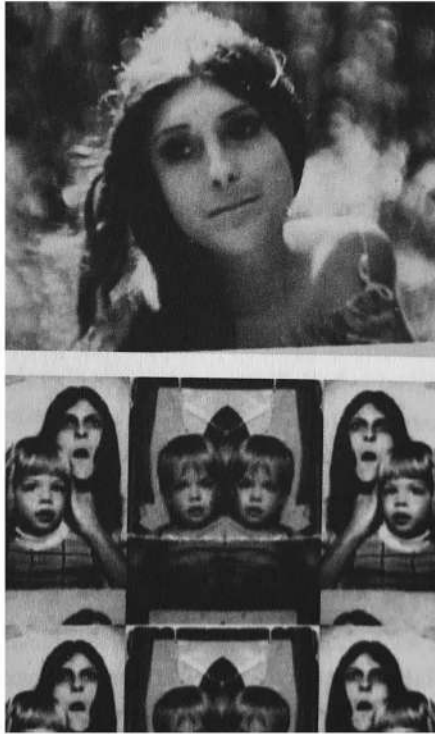
3/ Tarnation , Jonathan Caouette, 2003 te, 2003

Mésaventures et difficultés. Sont énumérés l'incendie du petit commerce d'Adolph, l'hystérectomie de Rosemary, le départ de Renee et Jonathan pour Chicago, le viol sous les yeux de l'enfant, le calvaire psychiatrique de la mère, l'abus du fils dans les maisons d'accueil. C'est à ce moment-là qu'on voit le premier « plan » de l'album qui a un statut faussé puisqu'il s'agit d'une prise de vue de Joshua, le fils de Jonathan dans la réalité, élément dont il n'est pas fait référence dans le film. Cette tentative de faire rejouer, via le montage, les scènes traumatiques par son propre enfant, sans en faire mention explicitement, donne le vertige. Le commentaire à l'œuvre, à la fin de ce premier feuilletage, se détruit lui-même en indiquant que les souvenirs que Jonathan, le cinéaste du film, a de sa mère, se sont pratiquement effacés. Le récit autobiographique expose donc sa falsification. La troisième section de l'album procède de l'alternance entre des plans tournés-gelés et des photos déformées dans leur dimension plastique : affaiblissement de l'éclairage, saturation pop des couleurs, clignotement horrible 25 . L'animation heurtée