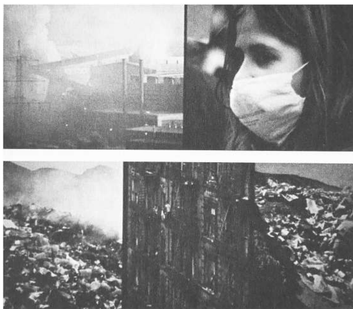
2/ Soleil vert (Soylent Green) , Richard Fleischer, 1973

se comprend selon cette même stratégie d'évitement. La prise de conscience de la catastrophe est rendue impossible par un aveuglement collectif. Comme au début du Fukasaku, le film réintroduit le contexte historique 18 . Mais il s'agit ici d'une histoire accélérée qui raconte la frénésie et la folie de l'industrialisation en partant d'une photo de famille encadrée dans les champs, autour de 1900, jusqu'au plan de New York, totalement enfumée par la pollution, en 2022 (fig. 2).